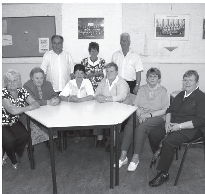
De vrijwilligers die al 5 jaar de bingo voor 55-plussers verzorgen.

Bewonersbelangengroep Landbouwbuurt Voorzitter Mevrouw S Welter telefoonnummer 024 - 3540178