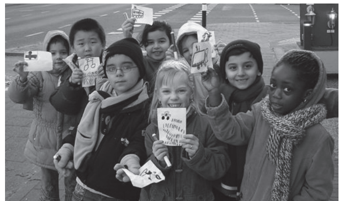
Deelnemende kinderen van basisschool Groot-Nijeveld

Op 22 juni horen wij of we een prijs gewonnen hebben. Maar wij vinden het allerbelangrijkste dat wij met kinderen, ouders en leerkrachten zo goed samen gewerkt hebben over het verkeer. Wij hopen dat iedereen goed uitkijkt en het nog veiliger wordt bij onze school!