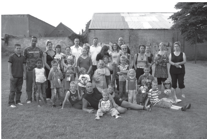
De deelnemers aan de Avondvierdaagse deze maand op het veldje achter De Haard.