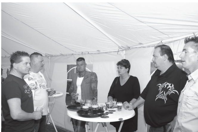
Iedereen die betrokken was bij het opnieuw inrichten van De Haard 25 jaar geleden.