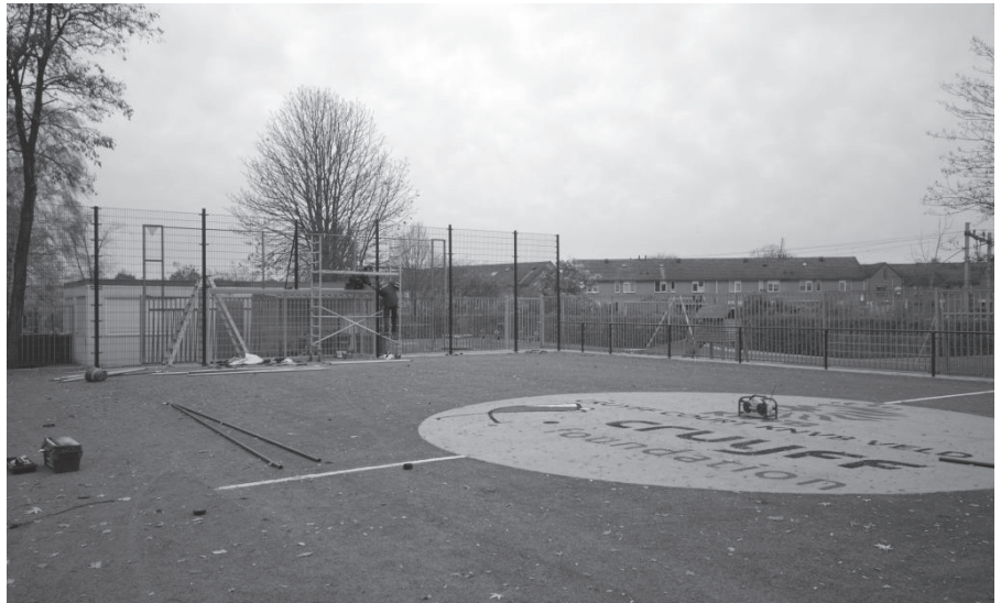
Het nieuwe Cruiffcourt aan de Genestedlaan is bijna klaar. Op 24 november vindt de officiële opening plaats.

Al deze instellingen lopen dus het risico dat er medewerkers ontslagen worden. Een tweede grote vraag is daarom: hoe gaan deze gaten gedicht worden? Dat blijft vooralsnog het grootste vraagteken.