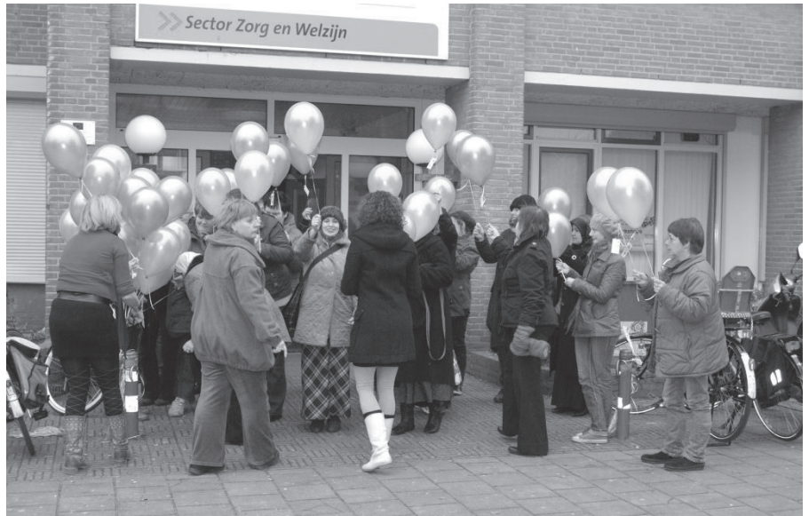
OKC Mengelmoes in vrolijkere tijden: de opening van de tijdelijke vestiging aan de Vossenlaan.

De meerderheid van de raad stemt er daarmee mee in dat een jaarlijks terugkerend tekort van 9 miljoen op het budget van deze gesubsidieerde banen inderdaad onaanvaardbaar is. Dat klinkt misschien logisch. Daarnaast slorpt het huidige aantal van 850 ID-ers bijna het volledige beschikbare budget voor reïntegratie op, zodat er voor 3000 werklozen geen reïntegratie-traject mogelijk is. Zo stelt wethouder Tankir. Maar het wordt tegelijk onvermijdelijk dat er bij allerlei instellingen en voorzie-