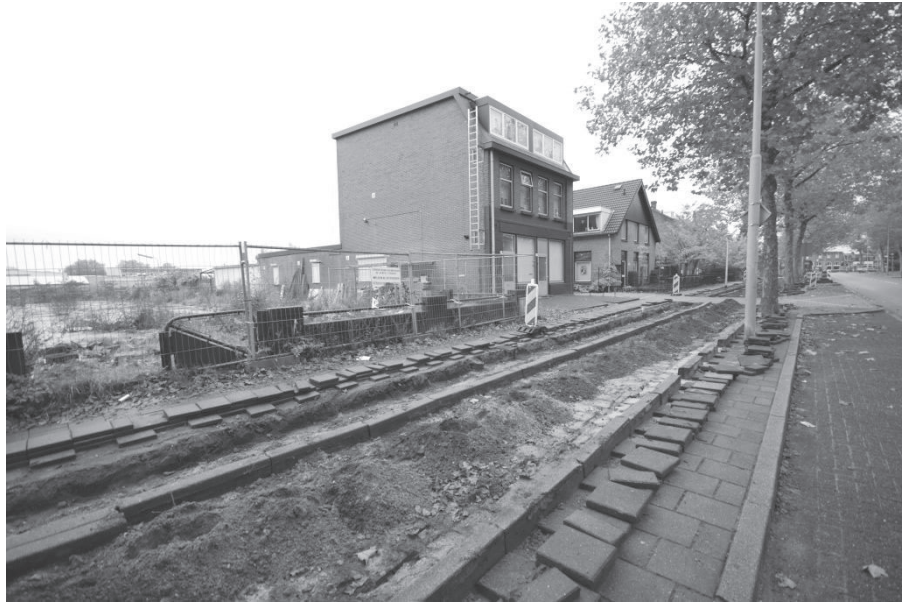
Voor de derde achtereenvolgende keer de tegels van het fietspad aan de Groenestraat verdwenen. Nu komt er asfalt voor in de plaats.

Dat komt natuurlijk doordat er meer auto's over de Groenestraat moeten rijden dan in 'normale' situaties. Maar het komt ook doordat er geruime tijd geen sprake is geweest van een normale situatie op de Groenestraat. De afgelopen maanden is de straat immers niet minder dan drie keer opengemaakt en weer dichtgemaakt. Eerst moesten er nieuwe gasaansluitingen onder de grond worden gelegd. Toen werden de tegels van stoep en fietspad weer teruggelegd. Vervolgens moesten er kabels de grond in. In dat geval bleven stoepen en fietspaden niet minder dan 9 weken open liggen voordat dezelfde tegels weer op hun plaats lagen. Sommige winkels waren gedurende die tijd moeilijk bereikbaar. Fietsers moesten over de rijweg en automobilisten moesten daar hun snelheid aanpassen. Ook dat deed de dagelijkse files flink toenemen. En toen dit achter de rug was, waren de tegels zelf aan de beurt, want nu worden de fietspaden geasfalteerd. Een betere afstemming van dit soort werkzaamheden is kennelijk niet mogelijk.