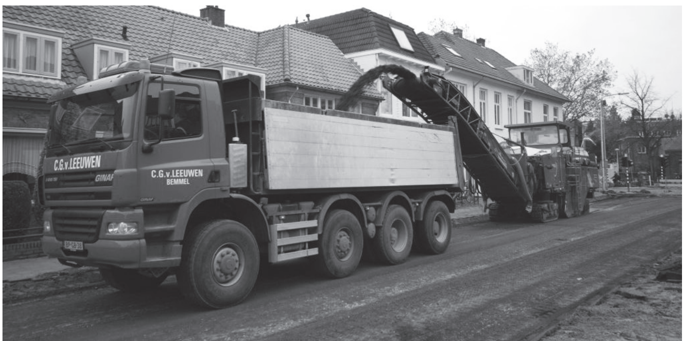
Ook de Willemsweg wordt onder handen genomen hier wordt het asfalt verwijderd op het stuk tussen de Groenestraat en de Da Costastraat in het Willemskwartier. De totale werkzaamheden rondom het voorzieningshart duren tot maart volgend jaar.

Nog steeds zal de bus echter regelmatig stilstaan. Dat zou volgens bewoners te maken hebben met de afstelling van de stoplichten ter hoogte van Willemsweg en Dr Schaepmanstraat. Ter hoogte van de Bilderdijkstraat zouden bewoners verder graag een vluchtheuvel in de weg aangelegd zien. Dan wordt het ook op dit punt in de normale situatie mogelijk daar de weg over te steken.