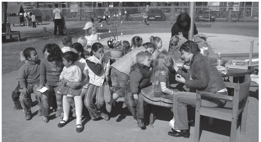
Een spelletjesdag in speeltuin Beetsplein