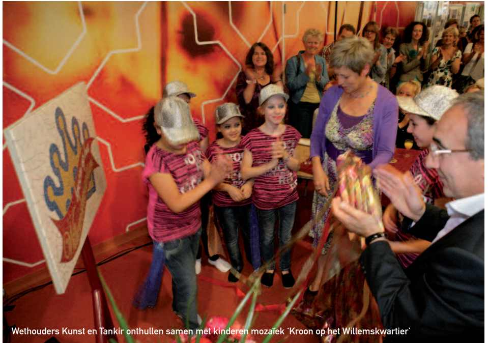
Wethouders Kunst en Tankir onthullen samen met kinderen mozaïek 'Kroon op het Willemskwartier'