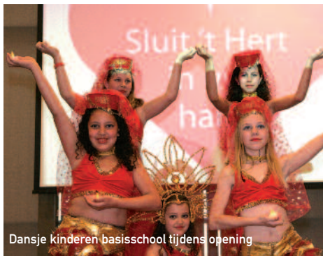
Dansje kinderen basisschool tijdens opening

Tussen 16 en 20 mei stonden de deuren van organisaties en clubs die een plek hebben gevonden in het voorzieningshart 't Hert wijd open. Veel mensen brachten een bezoekje en genoten van het aanbod. 👑