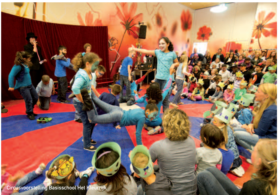
Circusvoorstelling Basisschool Het Kleurrijk