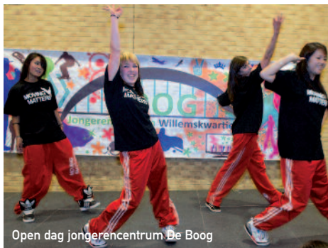
Open dag jongerencentrum De Boog