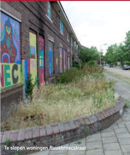
Te slopen woningen Ruusbroecstraat

N adat Portaal de sloop twee keer heeft uitgesteld, zodat er niet teveel grond braak ligt, gaat nu de sloop van de woningen aan de Ruusbroecstraat en omgeving definitief door. Op 1 oktober 2011 start Portaal met de sloop. Dat zal weer even een kaal beeld geven voor de wijk. De woningen worden dichtgeplaat, water en electra worden afgesloten en het gaat dan echt beginnen. Maar, er komt iets moois voor terug zoals huur- en koopwoningen. Ook komt er een appartementengebouw, dat qua stijl lijkt op het appartementengebouw aan de Stoppen-daalstraat.. De contracten van tijdelijke bewoners lopen nu af. Zij moeten zelf op zoek naar een andere woning. Ook het sociale plan voor oorspronkelijke bewoners loopt op zijn eind. Portaal helpt deze bewoners bij het vinden van een nieuwe woning. 🏠